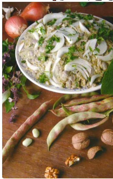
金時豆の胡桃の料理