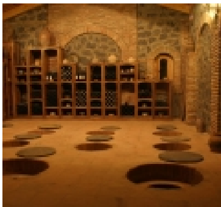
伝統的なワイン工房 (床にワインの壺を埋め込んでいる)

時間のめやす：午前06：00～12：00 午後12：00～18：00 夜18：00～23：00