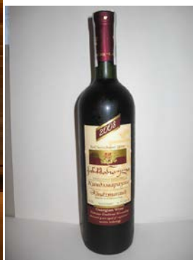
赤ワイン キンズマラウリ