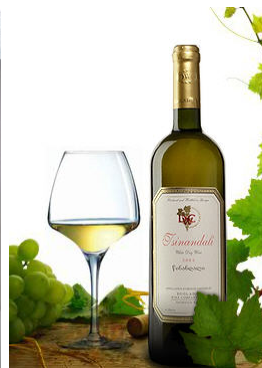
白ワイン ツンダーリ