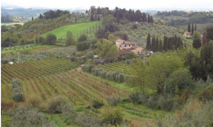
サン・ジミニャーノ周辺の田園風景