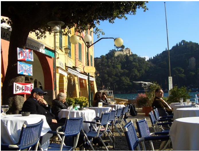
サンタ・マルゲリータ・リグレ