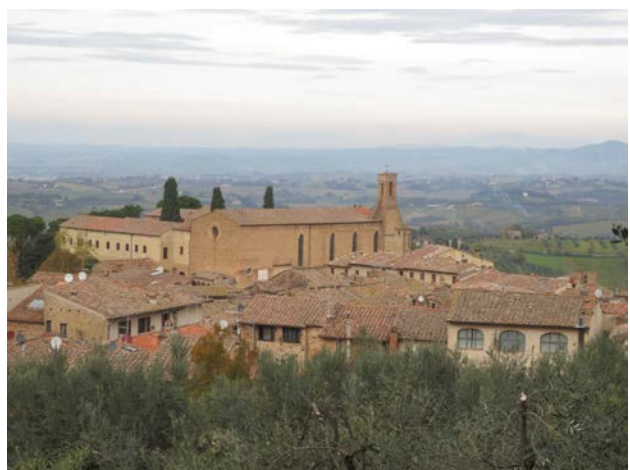
サン・ジミニャーノ