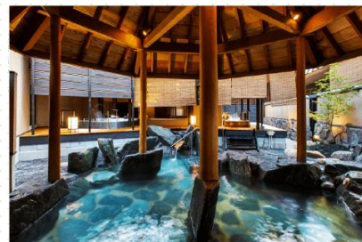
●庭園露天風呂 天地の湯