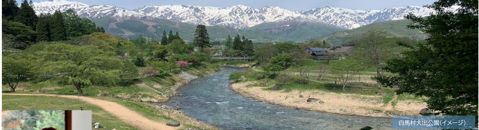
白馬村大出公園(イメージ)