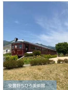
安曇野ちひろ美術館