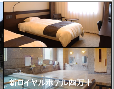
新ロイヤルホテル四万十