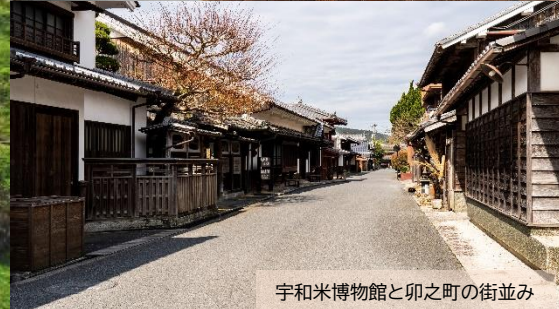
宇和米博物館と卯之町の街並み