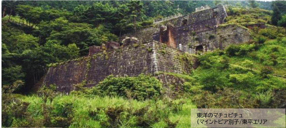
東洋のマチュピチュ (マイントピア別子/東平エリア)