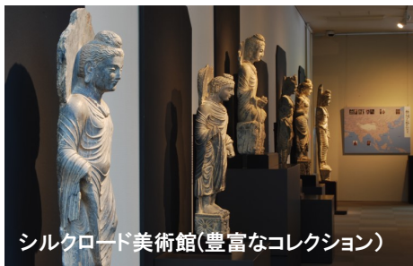
シルクロード美術館(豊富なコレクション)