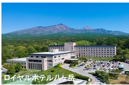
ロイヤルホテルハな岳