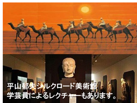
平山郁夫シルクロード美術館 学芸員によるレクチャーもあります。

*その他JR・新幹線スケジュール等不明な点などございましたら、どうぞお気軽にお問合せください。 手配手数料がかかりますが弊社にてお手配することも可能です。(手配手数料=¥1,100)